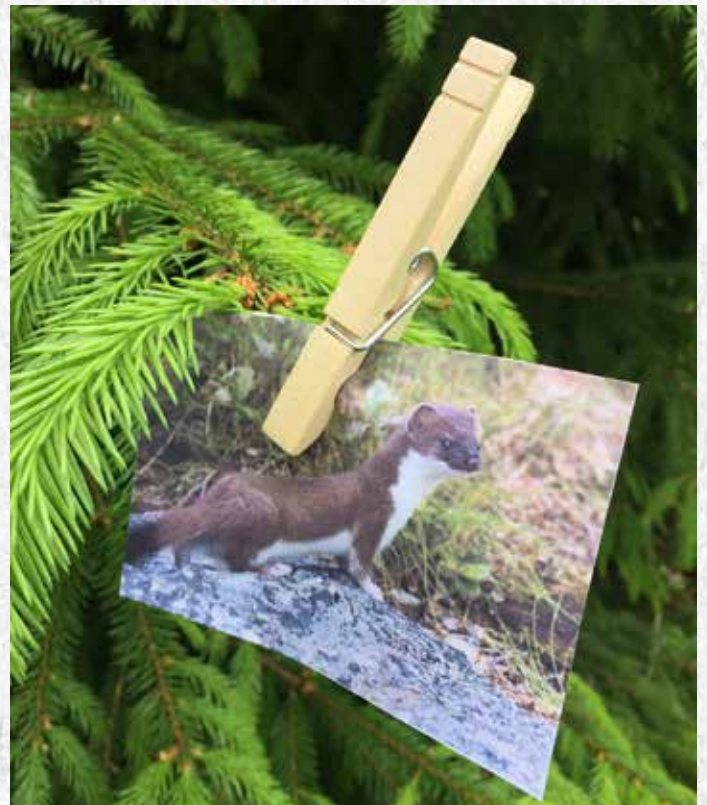
Hevoskenkä eli väriä vaihtava nisäkä.