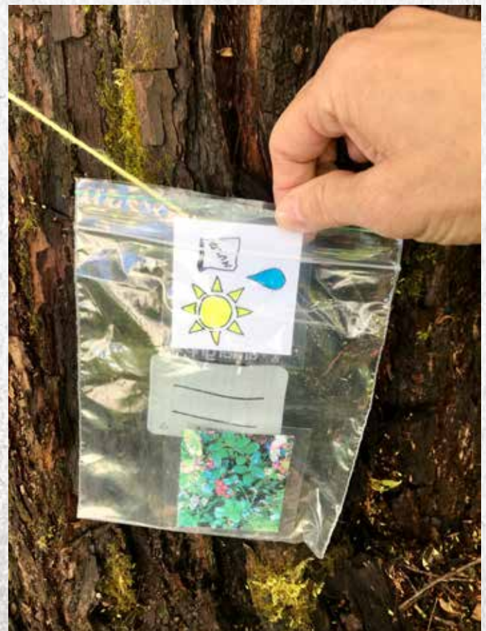
Jalokivenä puolukka, rahana kasvutekijät.

Lautapeli pihapeliversiot on alun perin kehitetty Suomen Ladun perheliikunnan hankkeessa. Syksyn tähti pohjautuu Suomen Ladun Afrikan tähti -pihapeliin.