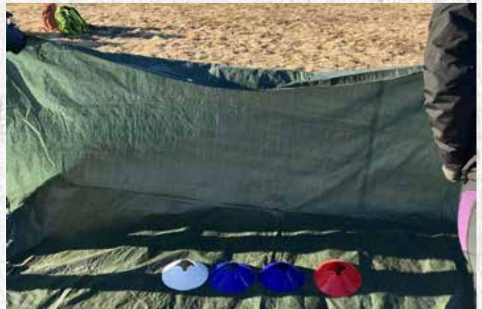
Koodi valmiina peliin.

Toimivinta on, jos kartioita on riittävästi vähintään kah- teen yhtäaikaiseen peliin, jolloin myös pressuja täytyy olla pelien määrän verran.