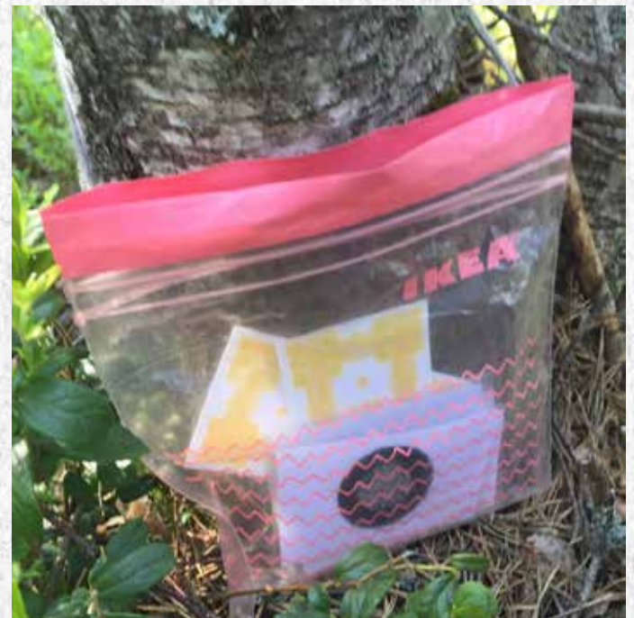
Jalokivipussiin on jätetty rahaa ja vastineeksi otettu jalokivi.

Lautapeliin pihapeliversiot on alun perin kehitetty Suomen Ladun perheliikunnan hankkeessa.