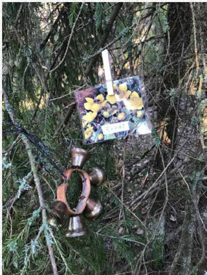
Kevään tähti piilossa kulkusen kanssa.

Kun joukkue on löytänyt kaikki kasvit, se saa lähteä etsimään Kevään tähteä. Kun tähti löytyy, puhalletaan pilliin, huudetaan "KEVÄT ON LÖYTÄNYT!" ja juostaan mahdollisimman pian kotipesään. Toinen joukkue, jolla on myös kaikki kasvit löydettyinä, voi vielä voittaa pelin, jos se löytää pillin puhalluksen jälkeen pölyttäjän ja ehtii juosta kotipesään ennen Kevään tähden löytäneitä. Peliä voi muokata tarpeen, olosuhteen ja vuodenajan mukaan.