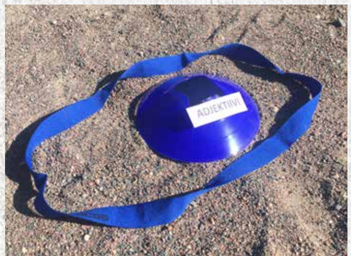
Pedagogisena pelimerkinä sanaluokka ja vanteen sijaan pelimerkinä joukkuenauha.