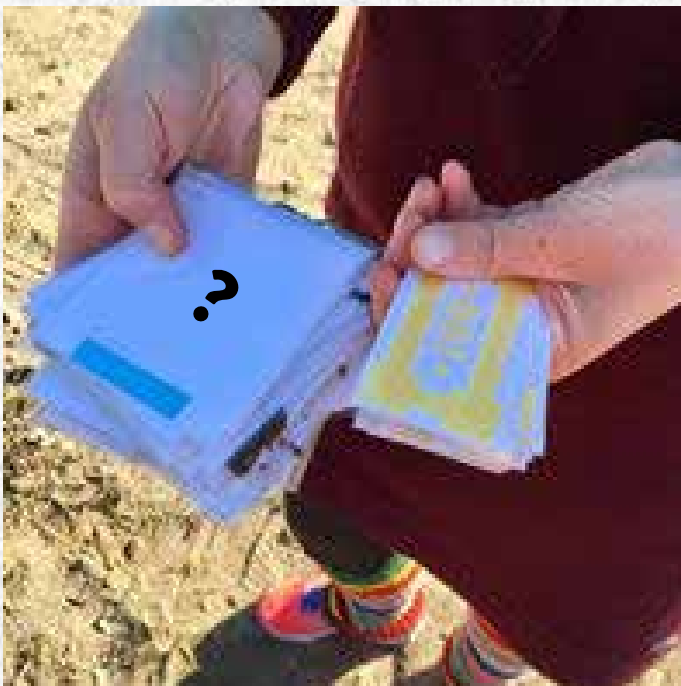
Pankkiiri teettää haluamiaan tehtäviä, joita vastaan saa pelirahaa lisää.

Se ryhmä, joka on ensimmäisenä saanut kasaan kaikki erilaiset pelimerkit, saa hakea Afrikan tähteä vastaavan merkin. Afrikan tähti on ollut koko ajan piilossa ja sen on voinut jo nähdä pelin aikana. Afrikan tähden löydyttyä pari soittaa tähden luona olevaa kelloa ja huutaa ”Afrikan tähti löytynyt”. Tämä on merkki muille, että tähti on löytynyt. Tällöin kaikki voivat vielä yrittää voittoa, etsimällä hevoskenkää vastaavan merkin ja juoksemalla kotipesään ennen Afrikan tähden löytänytä paria.