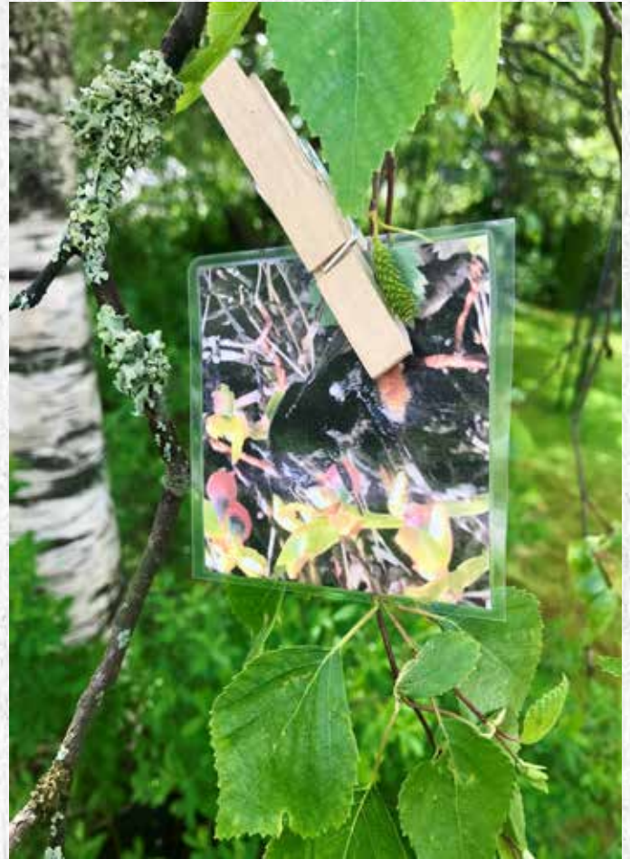
Kevään tähden 'hevosenkenkä' eli pölyttäjähönteinen.

Pölyttäjät ja kevään tähti piilotetaan yksittäisinä kuvakortteina pyykkipojilla metsään. Kevään tähden kanssa laitetaan roikkumaan pilli. Pelin johtaja (=pankkiiri) käy