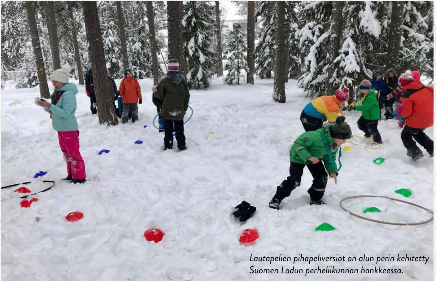
Lautapeliin pihapeliversiot on alun perin kehitetty Suomen Ladun perheliikunnan hankkeessa.