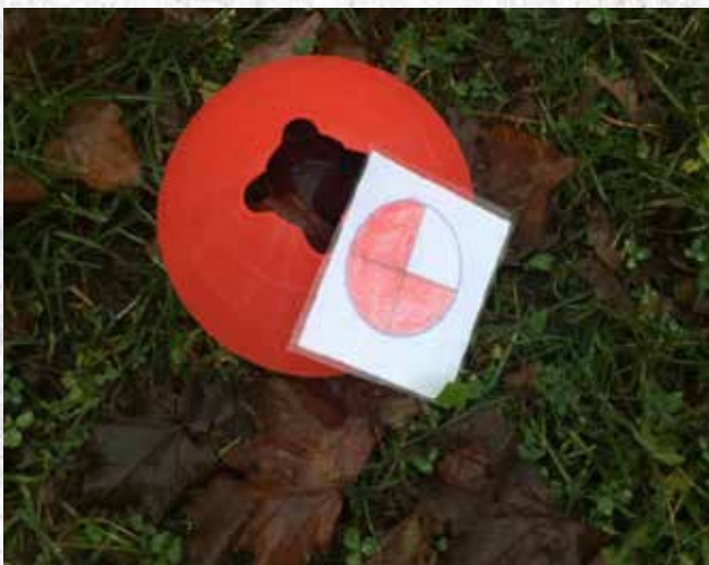
Pedagogisena pelimerkinä murtolukukakku ja alla tarkastusta varten vastaava määrä murtolukuna tai prosenttina.

Oppilaat jaetaan neljään ryhmään. Jokainen ryhmä asettuu jonoon omalle paikalleen. Jokainen ryhmä saa nipun samoja kysymyksiä/kuvia, jotka on koodattu sopimaan oman ryhmän väriin. Jonosta ensimmäinen astuu peliympyrän puolelle kasvot vasten omaa jonoaan. Hän esittää kysymyksiä, joihin oikein vastaamalla pääsee siirtämään vanteen ja juoksemaan pelikentän ympäri. Vastaajan pyytäessä koko ryhmä saa pohtia oikeaa vastausta. Ryhmän antamasta väärästä vastauksesta tulee vastaajan juosta sakkokierros siirtämättä vannetta. Huomioikaa, että juoksijat juoksevat kysyjien ja jonojen välistä. Kysyjää voi vaihtaa halutessaan neljän kysymyksen jälkeen. Seuraavan kysymyksen saa esittää heti, kun edellisen kysymyksen juoksija on lähtenyt liikkeelle mutta vastauksen voi sanoa vasta juoksijan ollessa takaisin jonossa. Koko ryhmä voi siirtyä myös pelimerkin mukana jonossa! Voittaja kuten versiossa 1.