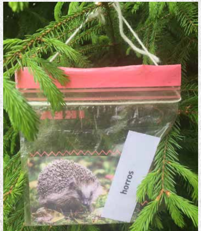
Jalokivenä siili, rahana horroslappu.

Lautapeli pihapeli-versiot on alun perin kehitetty Suomen Ladun perheliikunnan hankkeessa. Talven tähti pohjautuu Suomen Ladun Afrikan tähti -pihapeliin.